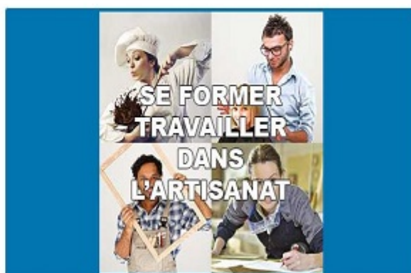
Se former - Travailler dans l'Artisanat