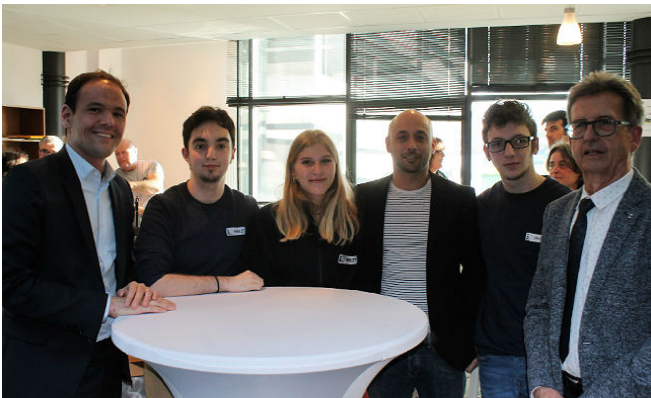
Photos: Cedric O, en compagnie du service Jeunesse de la Maison pour tous de la Ville d'Anglet