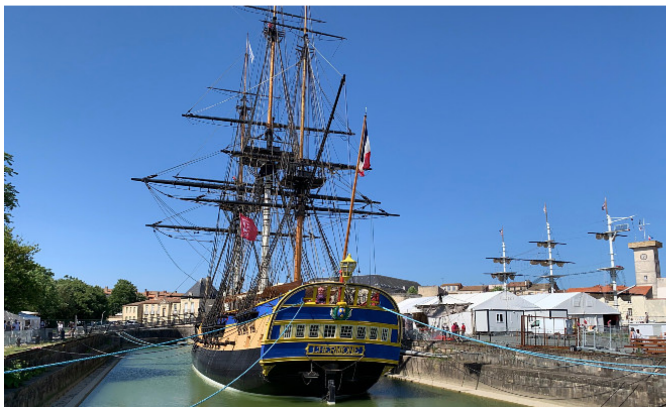
En longeant la

Après Rochefort nous continuons vers Tonnay-Charente. On tombera d'ailleurs nez à nez avec la poupe de l'Hermione et nous avons été impressionnés par la longueur et la grandeur des bâtiments de la Corderie royale. On roule à une fière allure. Notre objectif : rejoindre Saint-Savinien. En attendant, le vent d'est se fait sentir. Nous étions sur certaines portions totalement face au vent. Ce n'est pas facile de lutter. Nous sommes arrivés aux environs de 15 heures 20 à Saint Savinien. Le souci, c'est qu'entre Tonnay-Charente et Saint-Savinien, nous n'avons trouvé aucune supérette de village et aucun moyen de se restaurer. On a finalement fini par rallier la grande surface de Saint-Savinien pour trouver notre bonheur. À la sortie du magasin, un monsieur est venu nous demander ce que nous emprunions comme itinéraire. Il fait aussi la Flow Vélo ; mais en famille avec sa compagne et ses enfants. Ils sont partis de l'île de Ré et arriveront la semaine prochaine à Thiviers. « Nous sommes en vacances et en famille. Nous prenons notre temps » nous précise-t-il.