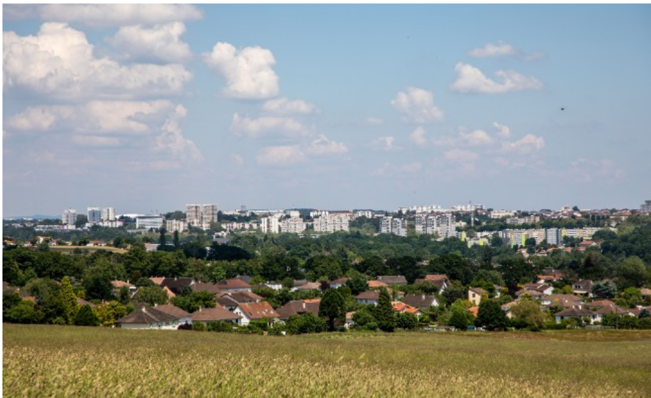
Le quartier du

Les logements sociaux seront requalifiés à l'image du programme de rénovation déjà mené dans la rue Franchet d'Espérey. Une place sera accordée au résidentiel avec de nouveaux logements construits à l'intérieur et à l'extérieur du quartier pour attirer de nouveaux habitants et favoriser la mixité sociale. Un travail important de restructuration sera mené sur les groupes scolaires Joliot-Curie et Masdoumier "sans suppressions de classes, assure l'élue, et en accord avec le projet pédagogique des deux écoles. Les décisions stratégiques seront arrêtées début 2022. Une partie des locaux sera réhabilitée et une autre démolie."